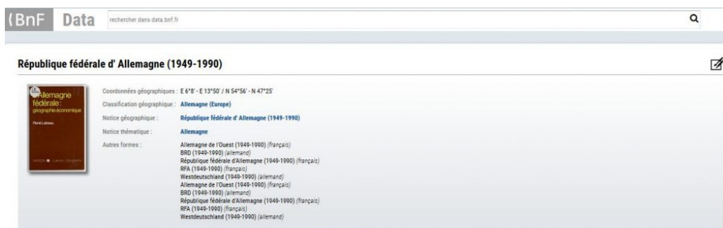
Copie d'écran de data.bnf.fr sur un lieu

Le nouvel affichage des pages d'œuvre permet de distinguer au premier coup d'œil, via des pictogrammes, les éditions d'une œuvre ayant été numérisées de celles qui ne disposent pas encore d'une version en ligne. Lorsque une version numérisée est disponible dans Gallica, « Consulter » permet de basculer sur l'interface de la bibliothèque numérique et « Télécharger » de récupérer le PDF.